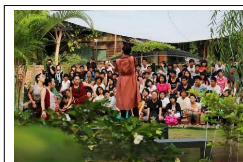
白水-在27號庭院演出