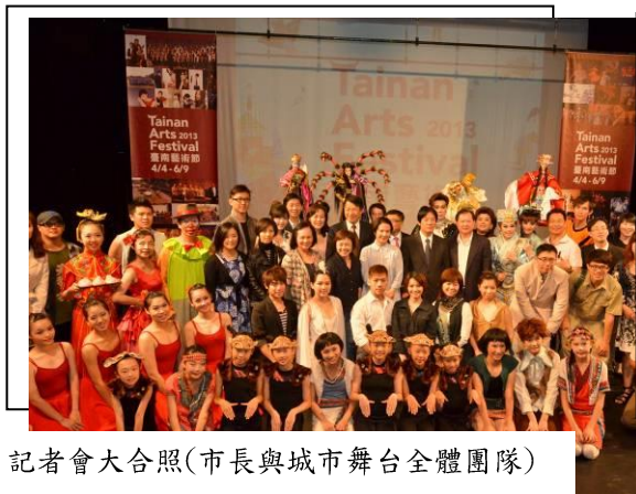
記者會大合照(市長與城市舞臺全體團隊)