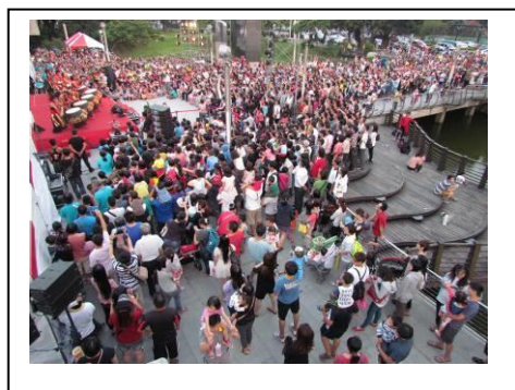
10 月 5 日觀眾人潮擠爆臺南文化中心園區