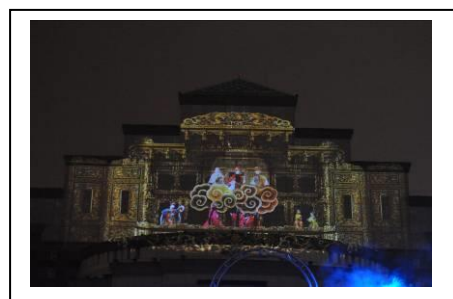
市府大樓建築外貌寬100米、高60米，透過這次創作，將變身為亞洲最大的單體建築牆面投影聲光秀舞台。