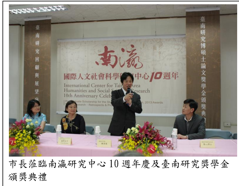
市長蒞臨南瀛研究中心 10 週年慶及臺南研究獎學金頒獎典禮