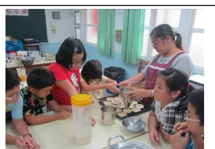
照片說明：快樂小廚~烘培營