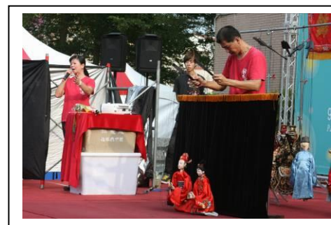
10 月 13 日錦飛鳳傀儡戲劇團於歸仁文化中心廣場演出