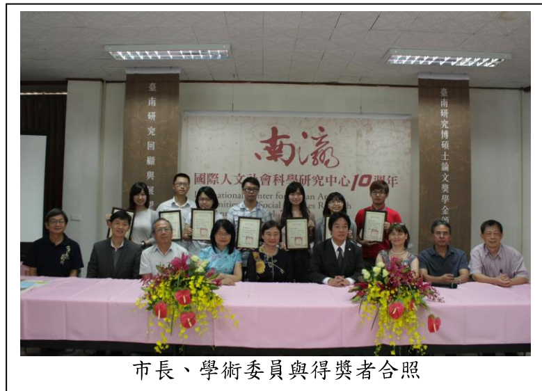
市長、學術委員與得獎者合照