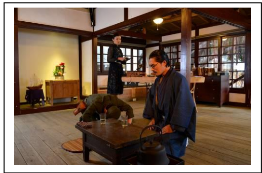
鐵支路邊創作體(城市舞臺)