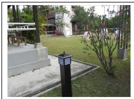
照片說明：戶外照明設備購置

保存防空洞現有樣貌及歷史意義，並進行彈性運用，透過藝術展示賦予其新的機能。並進行環境硬體設備改善，更符合防空洞使用上的安全性與便利性。