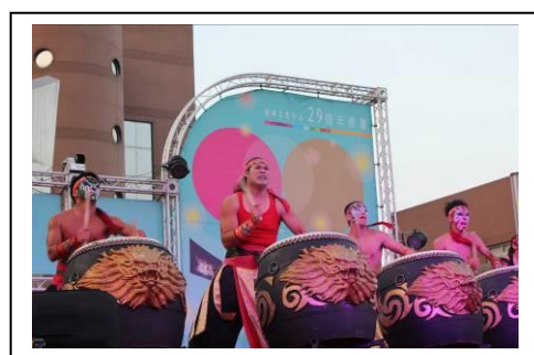
10 月 5 日九天民俗技藝團於臺南文化中心開幕演出