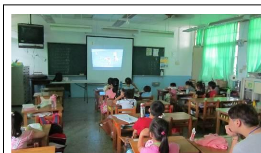
照片說明：兒童電影院

規劃有別於安親班的多元藝術學習課程，招收國小低年級生於每週一、三、四、五放學後，每天三節課程、每週共12節，讓學童可以從遊戲進入藝術，在藝術中當自己的主人！，一年共辦理2期，102年報名收入約62萬元，共計197人次參與。