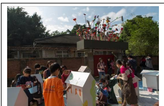
孩童忙彩繪/頭頂上還有崔正化清潔花的創作品