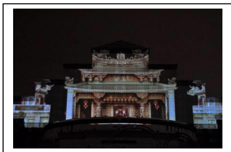
市政府大變裝，古都風華精銳盡出，躍登市府外牆！

本此活動演出時間為2月12日至14日(大年初三至初五)連續登場，共演出8場，呈現古都臺南的活力、趣味、創意、魅力。