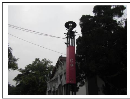
照片說明：攝影機監視系統設置