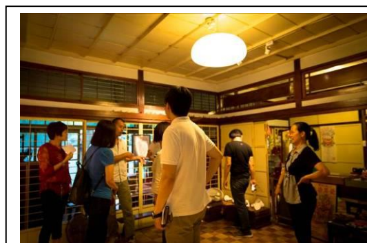
文化部參訪聚作聯合工作室一景