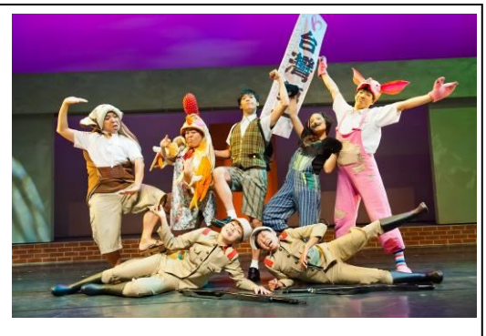
豆子劇團(臺灣精湛)